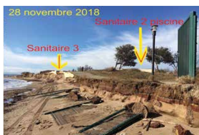
28 novembre 2018