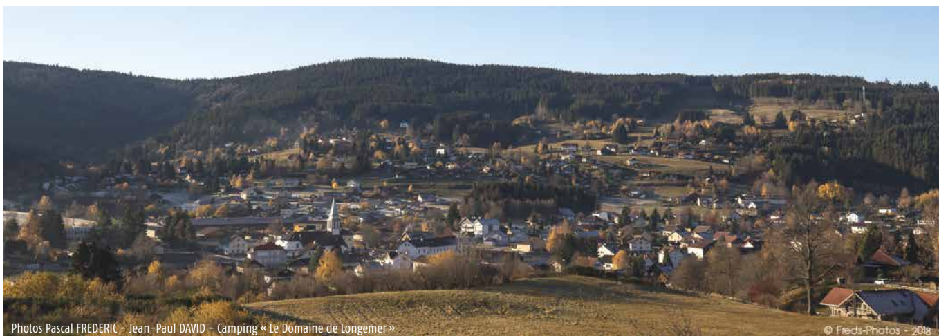
Camping « Le Domaine de Longemer »