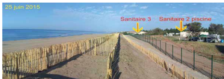
25 juin 2015