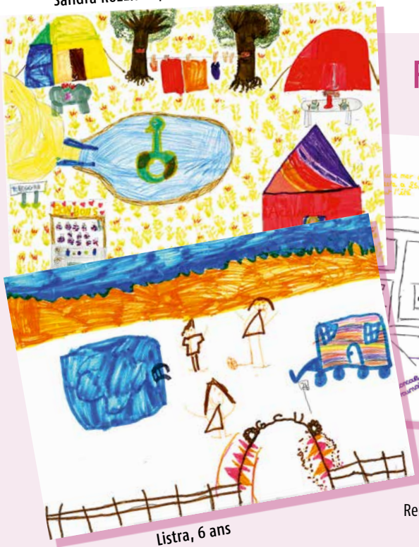
Listra, 6 ans