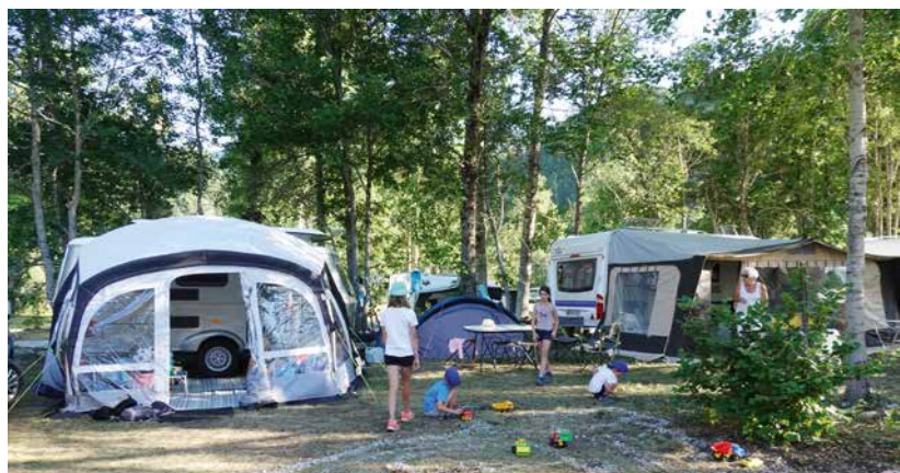
Mes enfants au camping