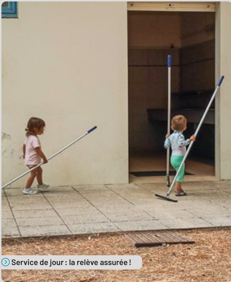
Service de jour : la relève assurée !