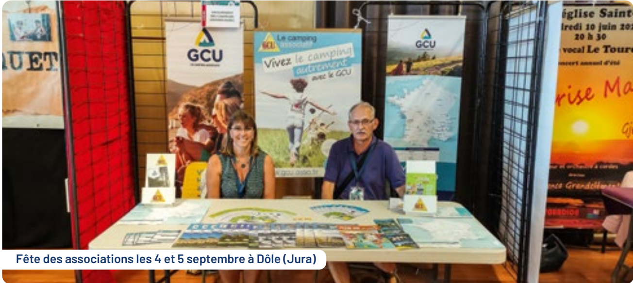
Fête des associations les 4 et 5 septembre à Dôle (Jura)