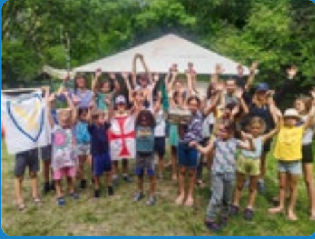
ANIMATIONS À PAILHAS