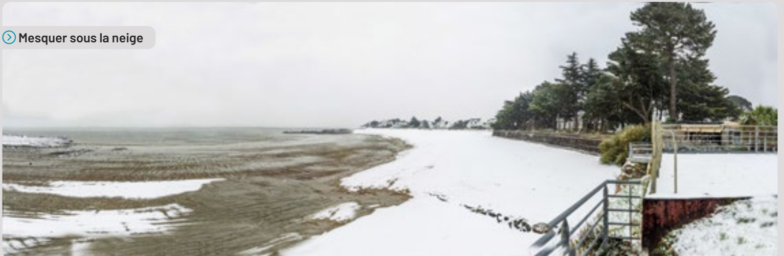
Mesquer sous la neige