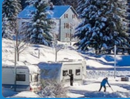
NOS CARAVANEIGES PRÉMANON ET LES MENUIRES