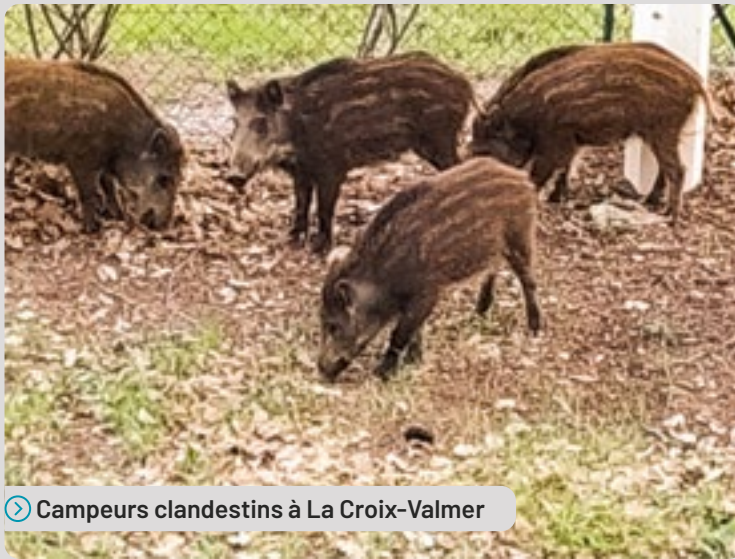
Campeurs clandestins à La Croix-Valmer