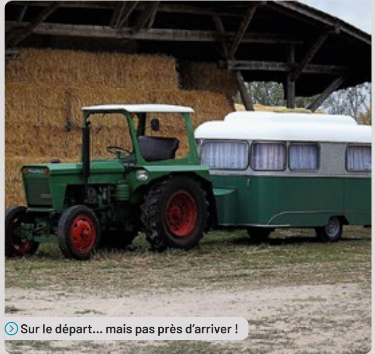
Sur le départ... mais pas près d'arriver !