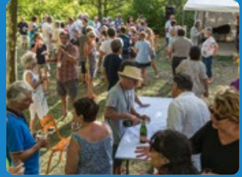
RASSEMBLEMENT ANNUEL 2021 DANS LE DIOIS