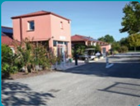
RASSEMBLEMENT ANNUEL À MONTECH