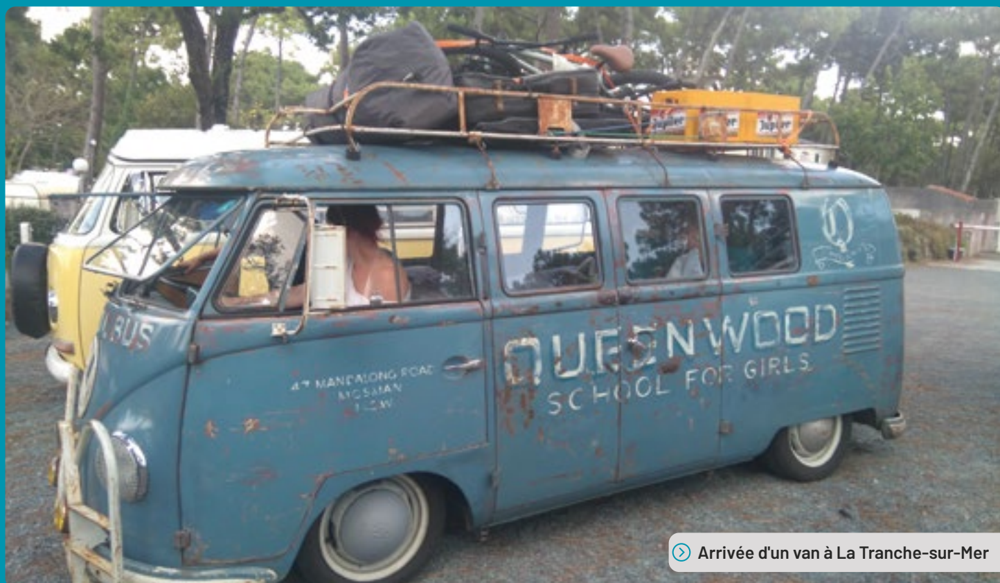
➤ Arrivée d'un van à La Tranche-sur-Mer