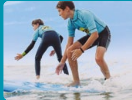
ACS NOUVELLE ACTIVITÉ