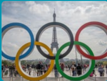
LES J.O. ET J.P. DE PARIS SE VIVENT EN CAMPING