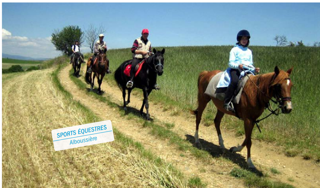
SPORTS ÉQUESTRES Alboussière

Activités : VTT de montagne, randonnées classiques - niveau moyen (bleu) niveau confirmé (rouge). Retour navette, possibilité location VTT.