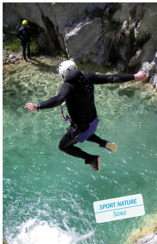
SPORT NATURE Sciez

Activités : via ferrata, canyoning, spéléologie, randonnées en montagne.