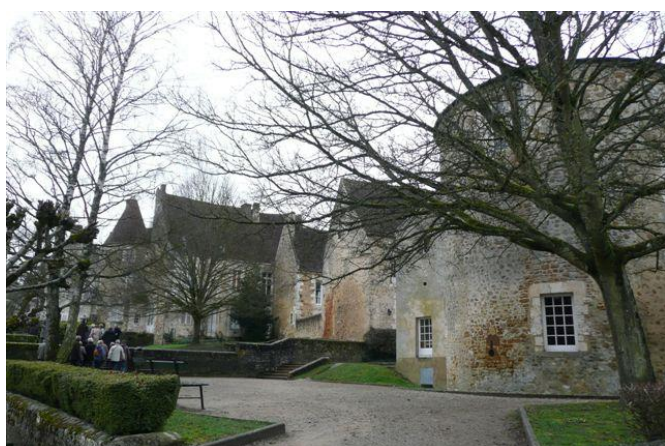
Devant la statue du philosophe Alain.

Emile-Auguste Chartier est natif de Mortagne-au-Perche. Un musée lui est consacré dans la Maison des Comtes du Perche.