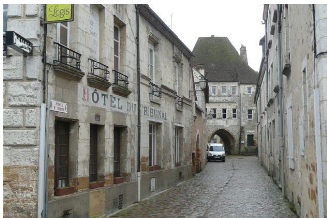
La Porte Saint Denis (XII ème et XIII ème siècle).

C'est le dernier vestige du Fort Toussaint qui faisait partie de la première enceinte fortifiée de la ville.