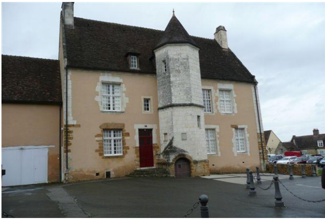
La maison du doyen de Toussaint (avec son escalier à vis).