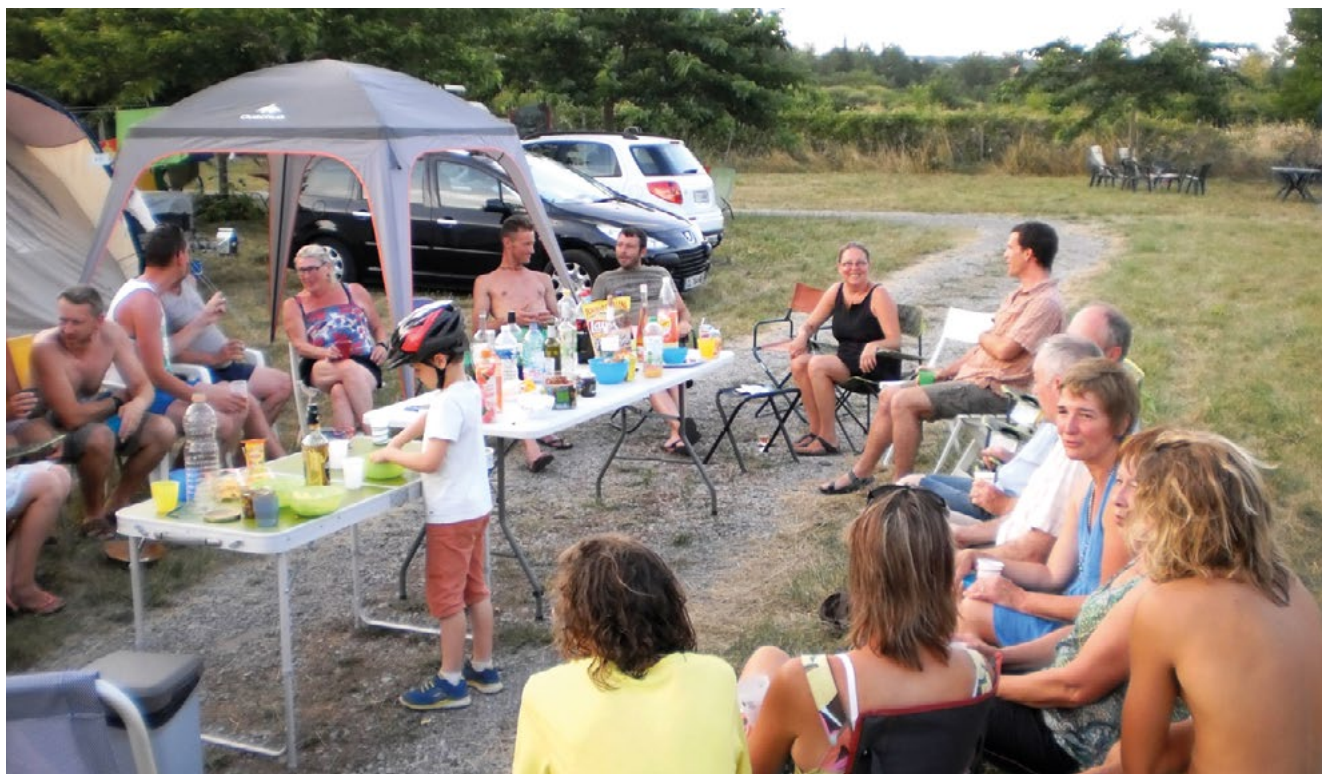
Moment de convivialité entre C.U.

Ces cas vécus sont heureusement minoritaires, mais ils reflètent un état d'esprit malsain qui gangrène peu à peu certains terrains puisqu'ils se perpétuent de génération en génération... hélas ! Je ne parle pas de ceux et celles qui oublient de faire leur service de façon volontaire, qui réfutent les règles de fonctionnement, qui « oublient » de déclarer un enfant ou un invité ou bien simplement de s'inscrire quand le camp est vide... mais chaque collectivité a ses moutons galeux. Le GCU, c'est la convivialité qui se retrouve autour d'une partie de boules, d'un apéritif ou d'un repas commun. Ces rencontres permettent de faire connaissance et d'animer cet esprit de convivialité, mais sous celui-ci se cache parfois un esprit de clan. Difficile parfois de jouer aux boules sur un terrain puisque les équipes sont constituées et que dire, lors d'un repas commun, de ne pas servir son voisin de table puisque ce n'est pas un « copain »... Cependant, j'aime ces terrains où spontanément, une famille ou un groupe organise un apéro communautaire pour simplement faire connaissance avec ses voisins.