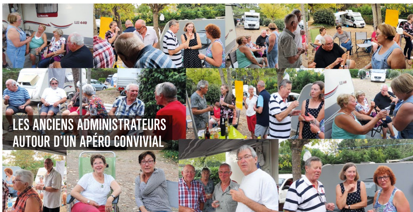
LES ANCIENS ADMINISTRATEURS AUTOUR D'UN APÉRO CONVIVAL

les années à suivre afin de montrer que les jeunes adhérents du GCU sont eux aussi impliqués et peuvent assurer la relève. Pour nous il était très important de faire passer ce message et de faire comprendre à tout le monde que les valeurs du GCU nous ont bien été transmises et que chaque adhérent devrait s'investir et prendre un peu plus de responsabilités !