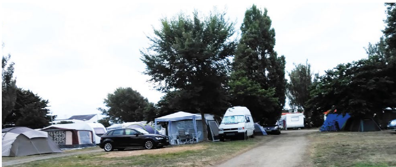
Emplacement d'un ancien responsable dans un camping de la côte atlantique... 4 personnes, un fourgon, une caravane et une grosse tente... + une voiture en plus sur l'emplacement voisin...

Le règlement stipule que les litiges peuvent être réglés par le conseil des campeurs, mais comment faire si celui-ci n'adhère pas. Lors d'un conseil des campeurs, j'ai entendu quelqu'un dire que les DO doivent faire remonter les problèmes créés sur le terrain par des jeunes un peu trop alcoolisés... Comment faire remonter si le DO n'a pas assisté au conseil de camp... qui n'a pas eu lieu ? Le DO ne peut faire remonter les informations que s'il est mis au courant des incidents et surtout si un conseil de campeurs a eu lieu.