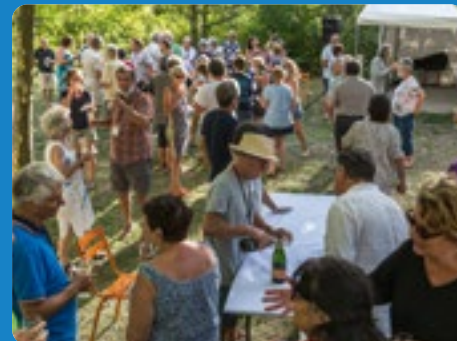
RASSEMBLEMENT ANNUEL 2021 DANS LE DIOIS