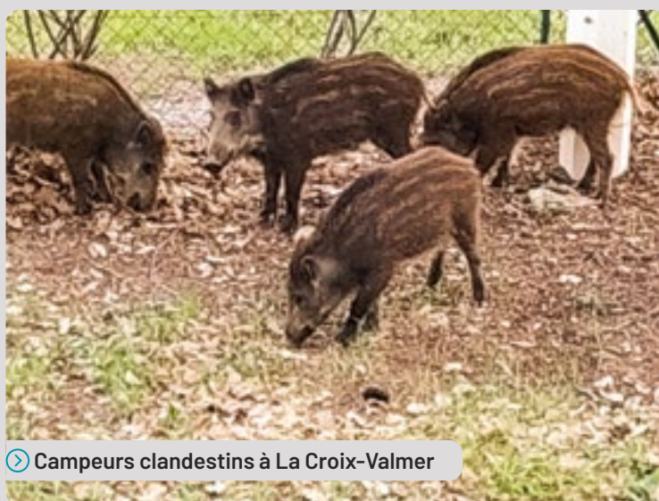
➤ Campeurs clandestins à La Croix-Valmer