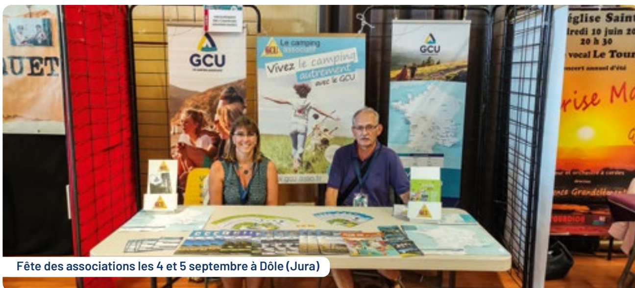
Fête des associations les 4 et 5 septembre à Dôle (Jura)