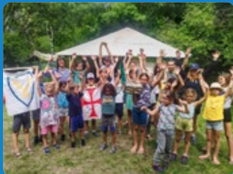
ANIMATIONS À PAILHAS