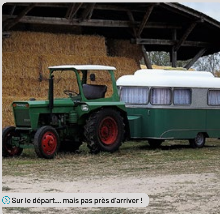
➤ Sur le départ... mais pas près d'arriver !