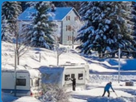
NOS CARAVANEIGES PRÉMANON ET LES MENUIRES