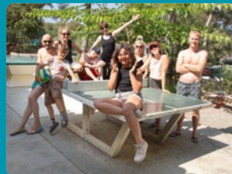
ANIMATIONS SUR NOS CAMPINGS