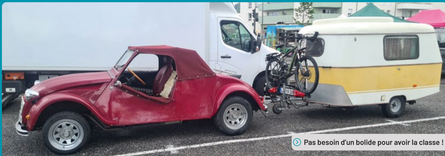
➤ Pas besoin d'un bolide pour avoir la classe !