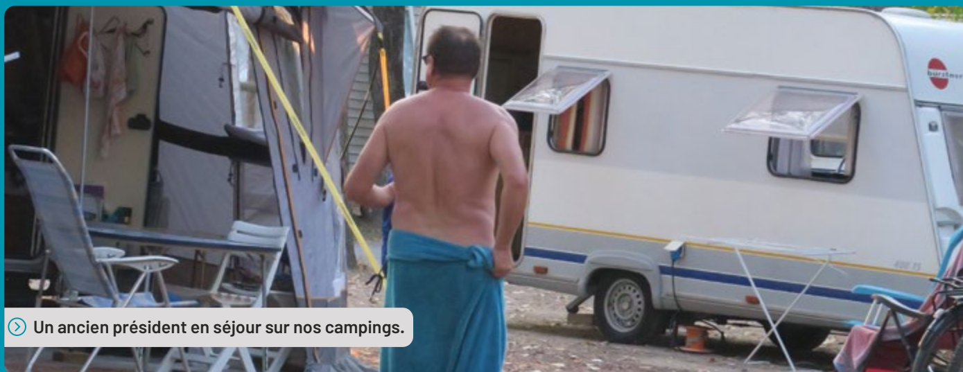
➤ Un ancien président en séjour sur nos campings.