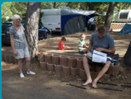
TARIFS ET DATES D'OUVERTURE CAMPINGS