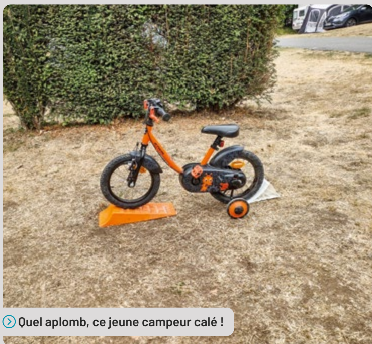
➤ Quel aplomb, ce jeune campeur calé !