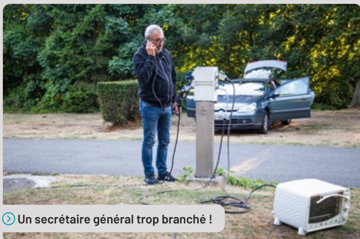
➤ Un secrétaire général trop branché !