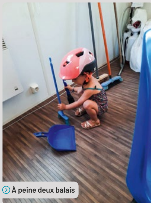
➤ À peine deux balais