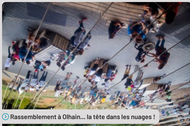
➤ Rassemblement à Olhain... la tête dans les nuages !