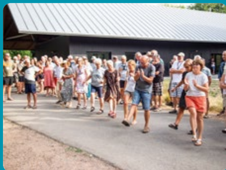
RASSEMBLEMENT À OLHAIN