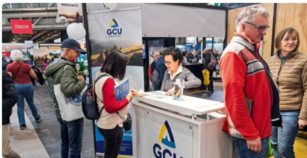
Salon Destination nature Paris