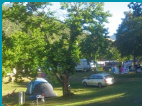
CAMPING NATURE : SAUMANE (GARD)