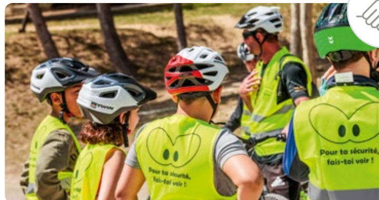
➤ Action Prévention MAIF savoir rouler à vélo dans une école.

Pendant vos vacances, vous faites souvent du vélo. Notre action "Savoir rouler à vélo" permet aux enfants âgés de 6 à 11 ans de bénéficier des apprentissages nécessaires à la pratique du vélo en autonomie et en sécurité avant l'entrée au collège. Cette action permet de prendre conscience des risques et d'adopter les bons comportements ainsi que les bons réflexes.