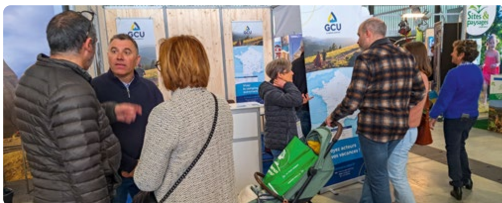
Salon Occ'ygene Toulouse