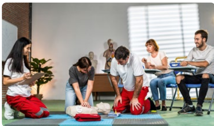
➤ Action Prévention MAIF les Gestes qui sauvent.

En campant vous partagez l'espace avec d'autres personnes. Vous pouvez être confronté à secourir votre voisin, par exemple. Nous proposons l'action "Gestes Qui Sauvent" destinée principalement aux collégiens ainsi qu'aux familles ou plus spécialement aux seniors, action animée par un secouriste spécialiste. Prévention MAIF organise partout en France des ateliers pratiques d'apprentissage des gestes de premiers secours. En complément nous avons aussi l'action "Apprendre à porter secours", qui propose des principes simples et accessibles à tous.