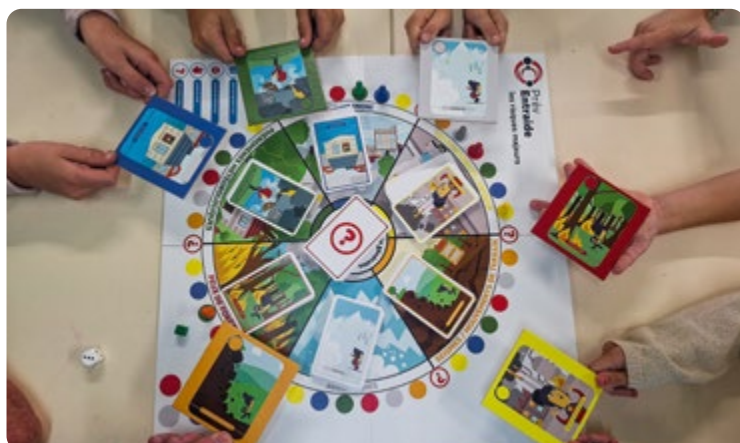
➤ Action dans une école avec le jeu PrévEntraide conçu par Prévention MAIF.

En camping, vous êtes souvent amené à vous baigner. Que ce soit à la mer ou dans un bassin aquatique, il est essentiel de connaître les dangers auxquels vous êtes exposé. Pour s'y préparer, nous avons créé le jeu collaboratif "1,2,3 baignade" à l'intention des 8-11 ans qui sensibilise les enfants aux risques liés à la baignade. L'intérêt de ce support atypique, avec la combinaison du numérique et du jeu en bois, a été confirmé.