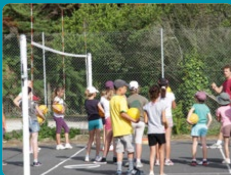
ACTIVITÉS CULTURELLES ET SPORTIVES