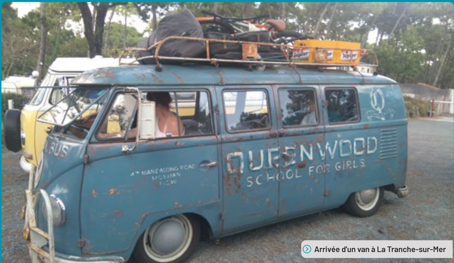
➤ Arrivée d'un van à La Tranche-sur-Mer