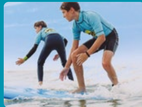
ACS NOUVELLE ACTIVITÉ