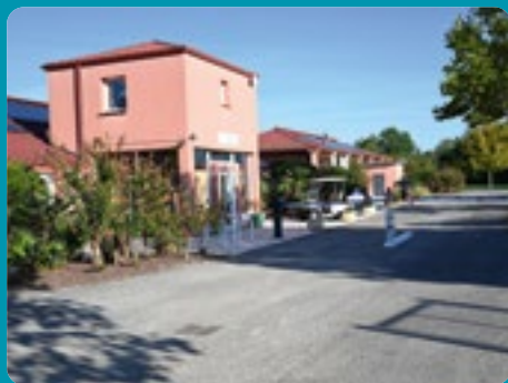
RASSEMBLEMENT ANNUEL À MONTECH