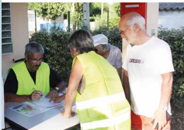
Exercice d'évacuation à Vias Kabylie : on pointe les présents