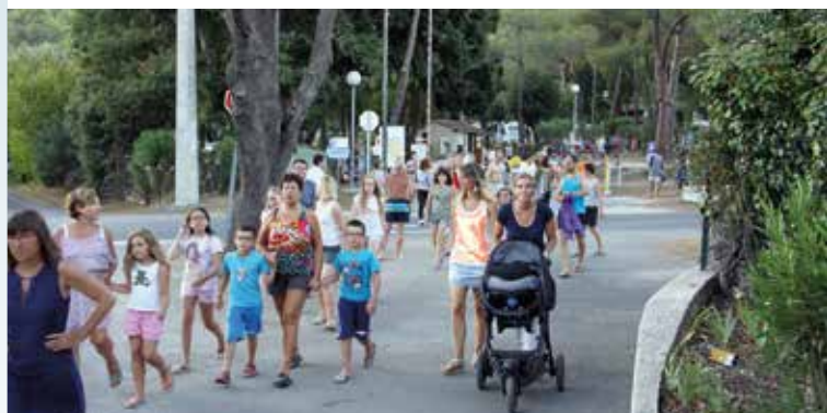
Exercice d'évacuation à Cavalaire : les campeurs rejoignent la zone de regroupement