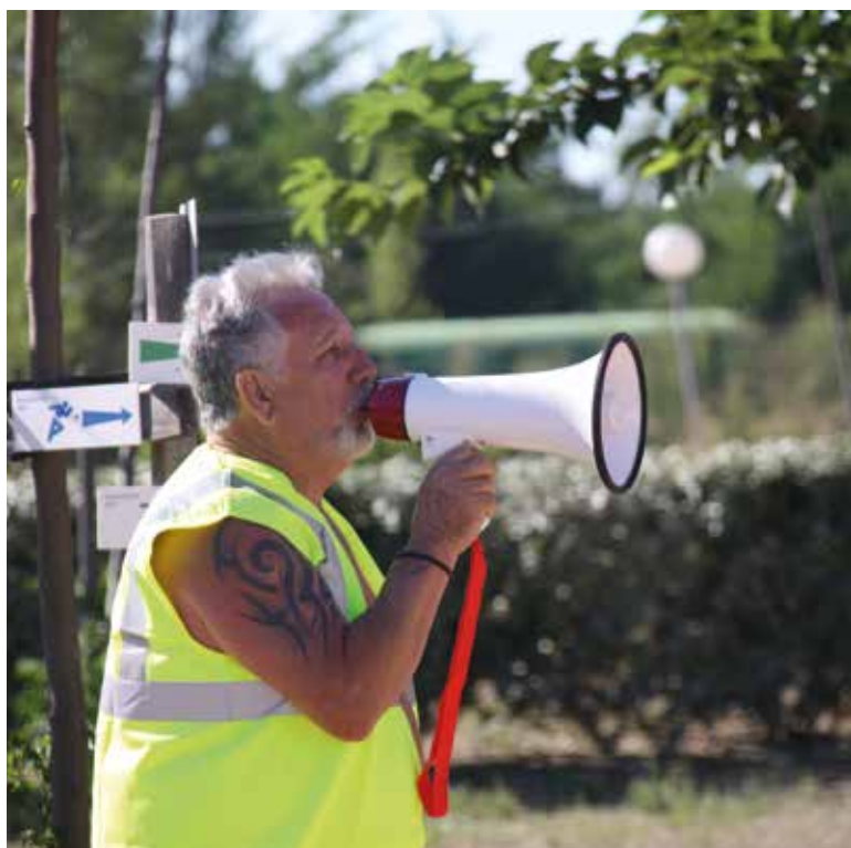
Exercice d'évacuation à Vias Améthyste : déclenchement de l'alerte

Nous envisageons de doter le référent sécurité et les gestionnaires de zones de gilets fluo.