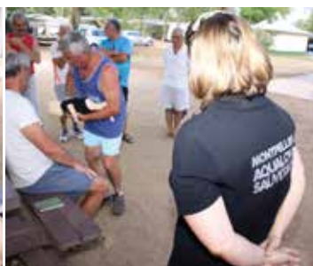
Obstruction des voies aériennes par un corps étranger