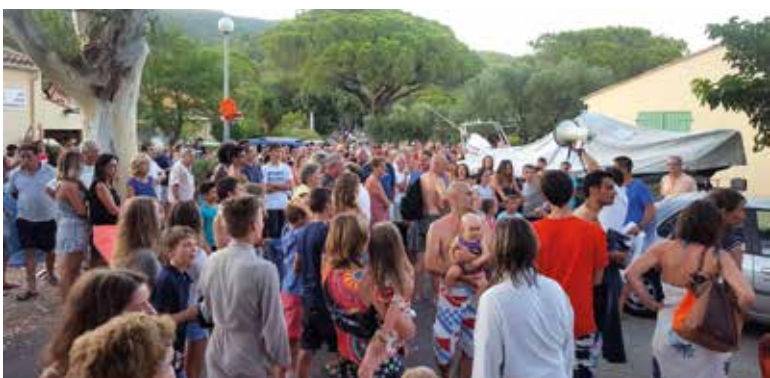
Exercice d'évacuation à Cavalaire : zone de regroupement