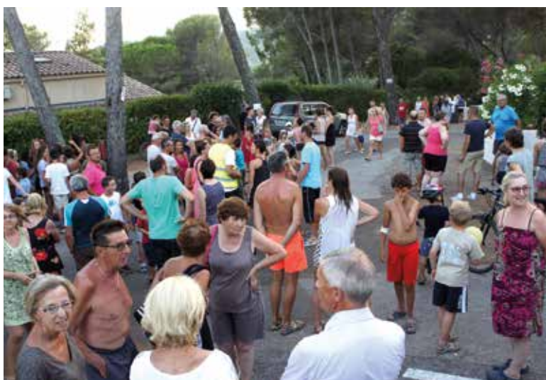
Exercice d'évacuation à La Croix-Valmer : zone de regroupement