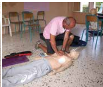
Arrêt cardiaque utilisation du défibrillateur