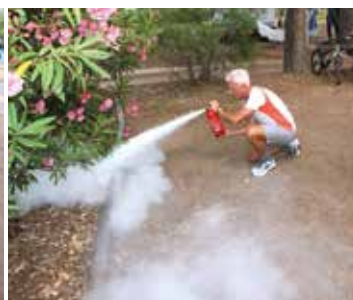
Sécurité incendie départ de feu