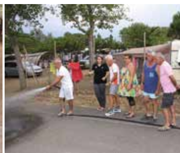
Sécurité incendie utilisation de RIA