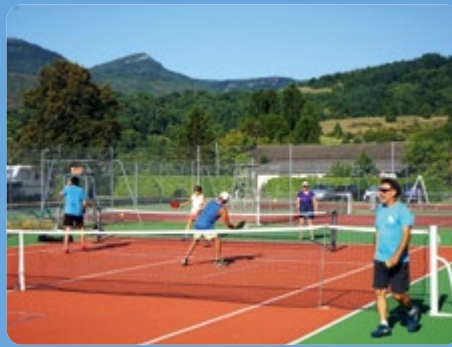
ACTIVITÉS CULTURELLES & SPORTIVES