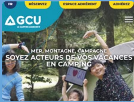
NOUVEAU SITE WEB