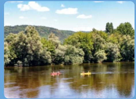
CASTELS - CAMPING RIVIÈRE